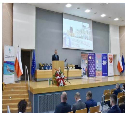
Fot. 22, 23. Sejmik Szkolnej Kultury Fizycznej – Warmińsko-Mazurski Szkolny Związek Sportowy w Olsztynie