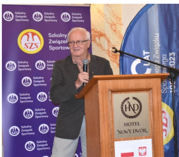
Fot 15,16. Sejmik Szkolnej Kultury Fizycznej – Podkarpacki Wojewódzki Szkolny Związek Sportowy