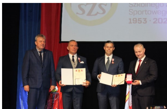
Fot. 24, 25. Sejmik Szkolnej Kultury Fizycznej – Wojewódzki Szkolny Związek Sportowy w Szczecinie

Naszym zdaniem cele i zadania jakie zostały postawione przed Sejmikiem Szkolnej Kultury Fizycznej zostały w pełni osiągnięte i zrealizowane.