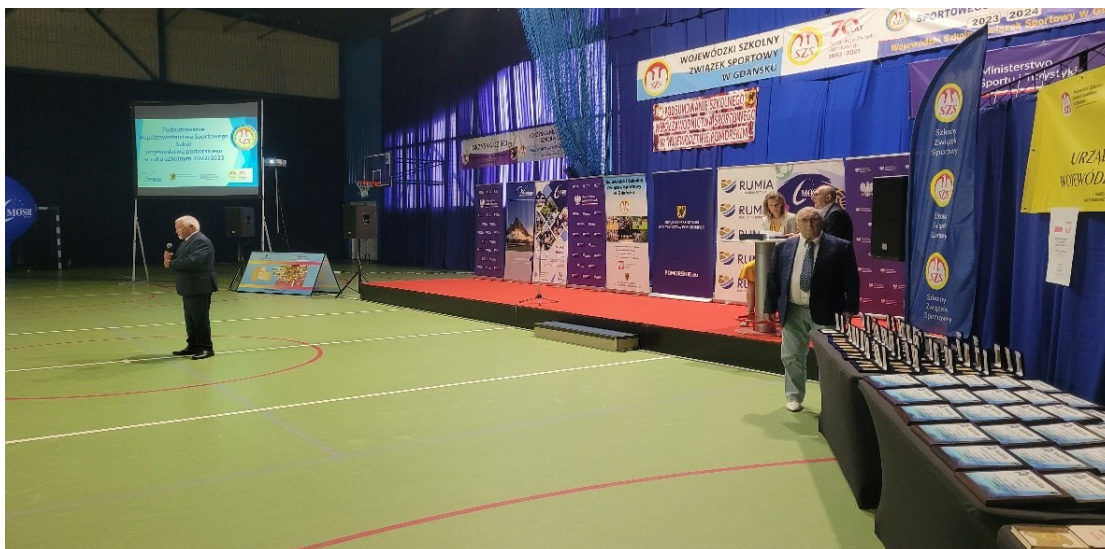
Fot. 19. Sejmik Szkolnej Kultury Fizycznej – Wojewódzki Szkolny Związek Sportowy w Gdańsku