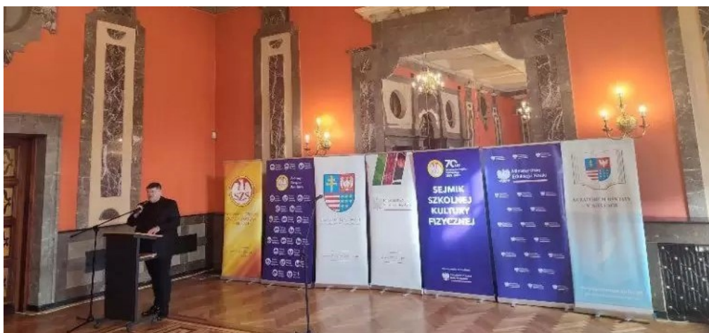
Fot. 21. Sejmik Szkolnej Kultury Fizycznej – Wojewódzki Szkolny Związek Sportowy w Kielcach