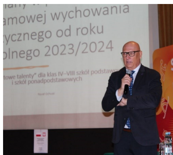
Fot. 10,11. Sejmik Szkolnej Kultury Fizycznej – Małopolski Szkolny Związek Sportowy