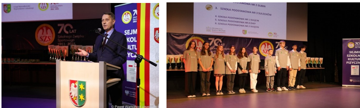
Fot. 6,7. Sejmik Szkolnej Kultury Fizycznej – Szkolny Związek Sportowy „Ziemia Lubuska”