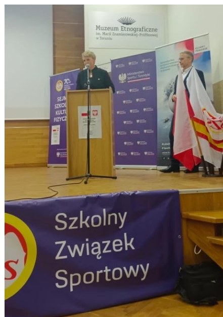
Fot. 3,4. Sejmik Szkolnej Kultury Fizycznej – Kujawsko-Pomorski Szkolny Związek Sportowy

Tegoroczna edycja Sejmiku Szkolnej Kultury Fizycznej została przygotowana trochę w innej – bardziej powszechnej formule i polegała na zorganizowaniu tego wydarzenia w szesnastu województwach, w których występują struktury wojewódzkie Szkolnego Związku Sportowego. Przyjęto też pewien katalog problemów i zagadnień, wokół których toczyła się debata. Były to: