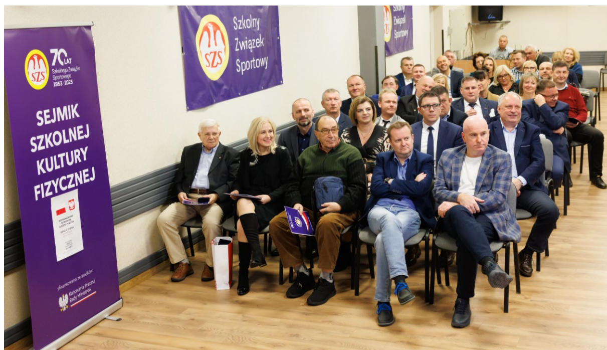
Fot. 5. Sejmik Szkolnej Kultury Fizycznej – Lubelski Wojewódzki Szkolny Związek Sportowy

Działalność Szkolnego Związku Sportowego od 70 lat na trwałe wpisała się w system sportu szkolnego. Wydaje się, że sformułowanie „w służbie dzieciom i młodzieży” oddaje istotę inicjatyw oraz programów podejmowanych przez osoby związane ze sportem szkolnym zarówno w ujęciu historycznym, jak i współczesnym. Historia Szkolnego Związku Sportowego prezentowana w trakcie kolejnych Sejmików Szkolnej Kultury Fizycznej stała się okazją do wielu wspomnień, retrospekcji oraz przywołania osób i wydarzeń, które na trwałe wpisały się w krajobraz sportu szkolnego.