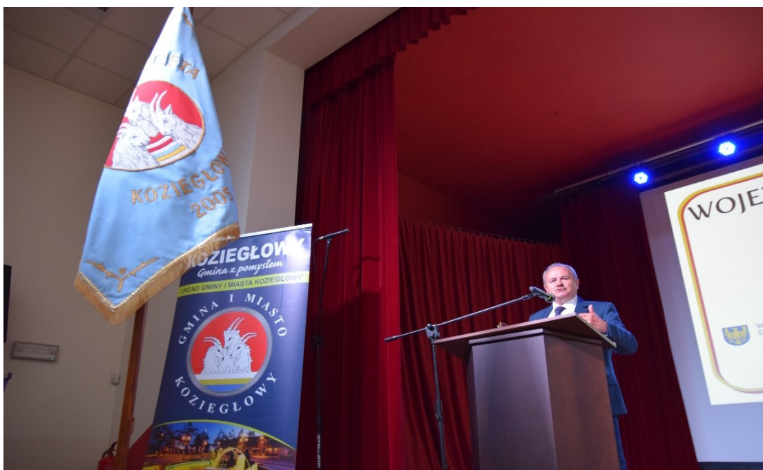
Fot. 20. Sejmik Szkolnej Kultury Fizycznej – Śląski Szkolny Związek Sportowy