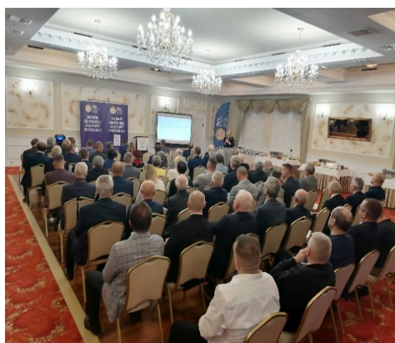
Fot. 17,18. Sejmik Szkolnej Kultury Fizycznej – Podlaski Wojewódzki Szkolny Związek Sportowy

W trakcie debat sejmikowych dużo miejsca i uwagi poświęcono aktualnym problemom sportu szkolnego. Były to panele dyskusyjne, w których głos zabierali działacze Szkolnego Związku Sportowego, organizatorzy sportu szkolnego, nauczyciele wychowania fizycznego, instruktorzy i trenerzy.