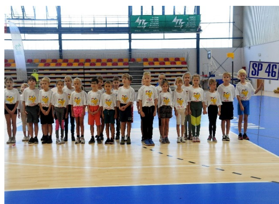
Fot. 1,2. Sejmik Szkolnej Kultury Fizycznej – Szkolny Związek Sportowy Dolny Śląsk

Sport szkolny – naszym zdaniem – jest obszarem i terenem merytorycznego wsparcia zadań wychowawczych, realizowanych w szkołach i placówkach oświatowo-wychowawczych. Jest źródłem samorealizacji ucznia, wszechobecny w wychowaniu i rozwoju jednostki, stanowi źródło radości i silnych przeżyć emocjonalnych, jest dla wielu uczniów płaszczyzną przyjaznych i życzliwych kontaktów z rówieśnikami, kształtuje umiejętność podporządkowania się