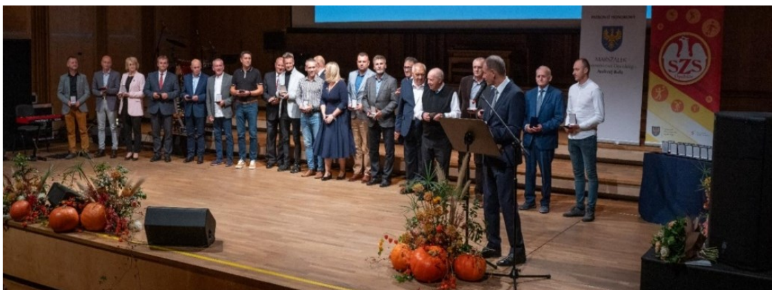
Fot. 14. Sejmik Szkolnej Kultury Fizycznej – Szkolny Związek Sportowy „Opolskie”